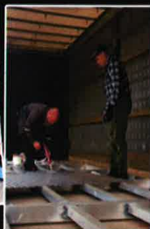
Levyjen asennus, kokka 12.8.2019