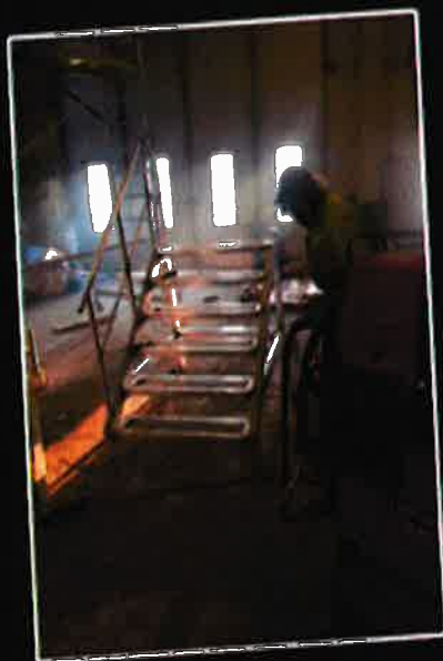
Portaat valmistuivat juuri sopivaan aikaan 28.8.2019