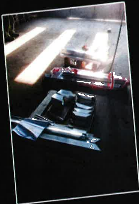
Portaiden hitsaus aloitettiin 22.8.2019