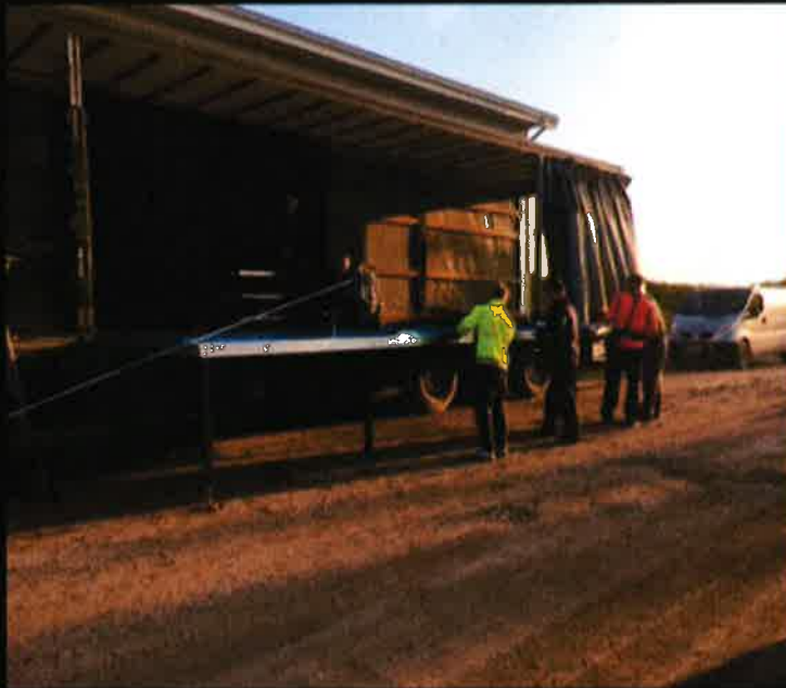
Kokkäpäivänä 22.8.2019 sovittiin alustan pressu paikallaan