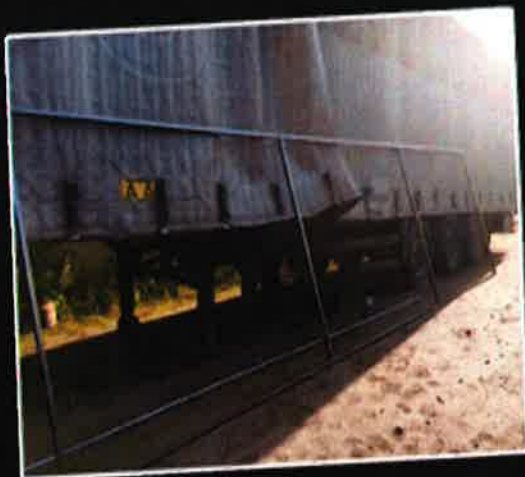
Lisäkatoksen runko hitsattiin ja maalattiin. Rungon päälle asennettiin sinistä vedenkestävää pressua