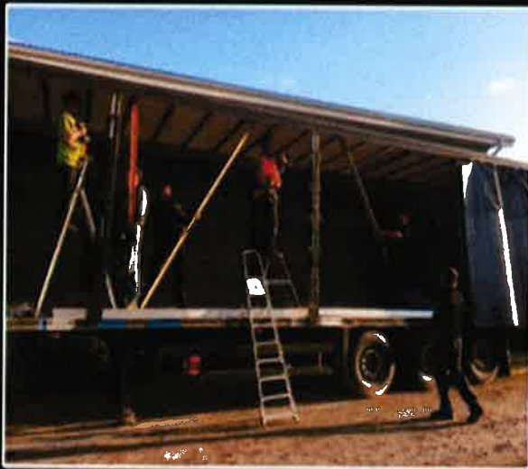
19.8.2019 oli vuorossa sisäverhouksen kiskojen asennus