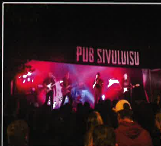
Kortesjärven Yrittäjien siirrettävä esiintymislava otettiin käyttöön 31.8.2019