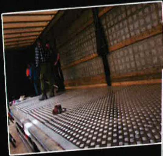
Levyjen asennustyö 12.8.2019