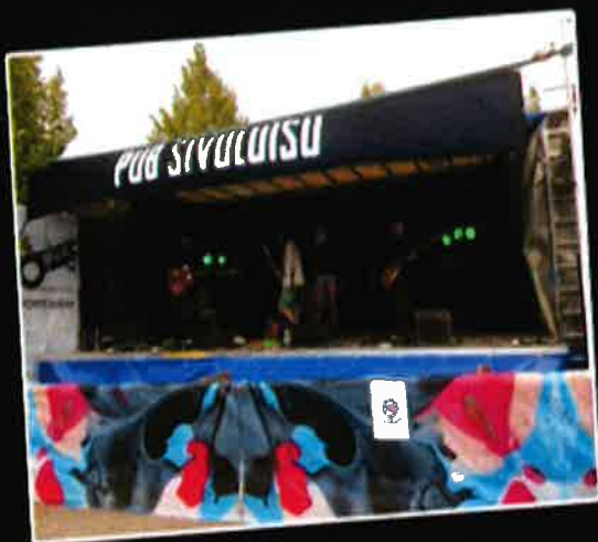
Järjestäjät pystyvät tuomaan omat elementinsä lavan rakenteisiin.